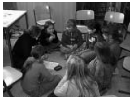
Abb. 1: Gruppendiskussionen mit Grundschulkindern

Die Gruppendiskussion als Methode hat dabei den Vorteil, dass eine Peer-to-Peer-Kommunikation stattfindet und Kinder einen anderen Verhaltensausschnitt zeigen können als in einem Einzelinterview. Als Nachteil sind gruppenspezifische Effekte zu nennen, d. h. die Gruppe erzeugt nor-